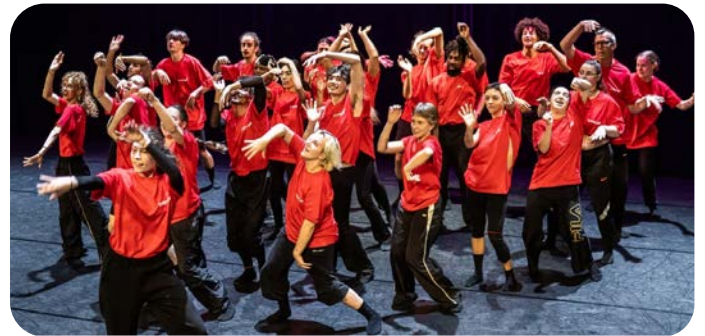
Voorstelling 'Scalabor Bruist', een mooi voorbeeld van verbinding

Met onze activiteiten hebben we het afgelopen jaar opnieuw laten zien dat Scalabor in kansen en mogelijkheden denkt, in plaats van in beperkingen. Precies datgene waar we ons dagelijks voor inzetten op de arbeidsmarkt!